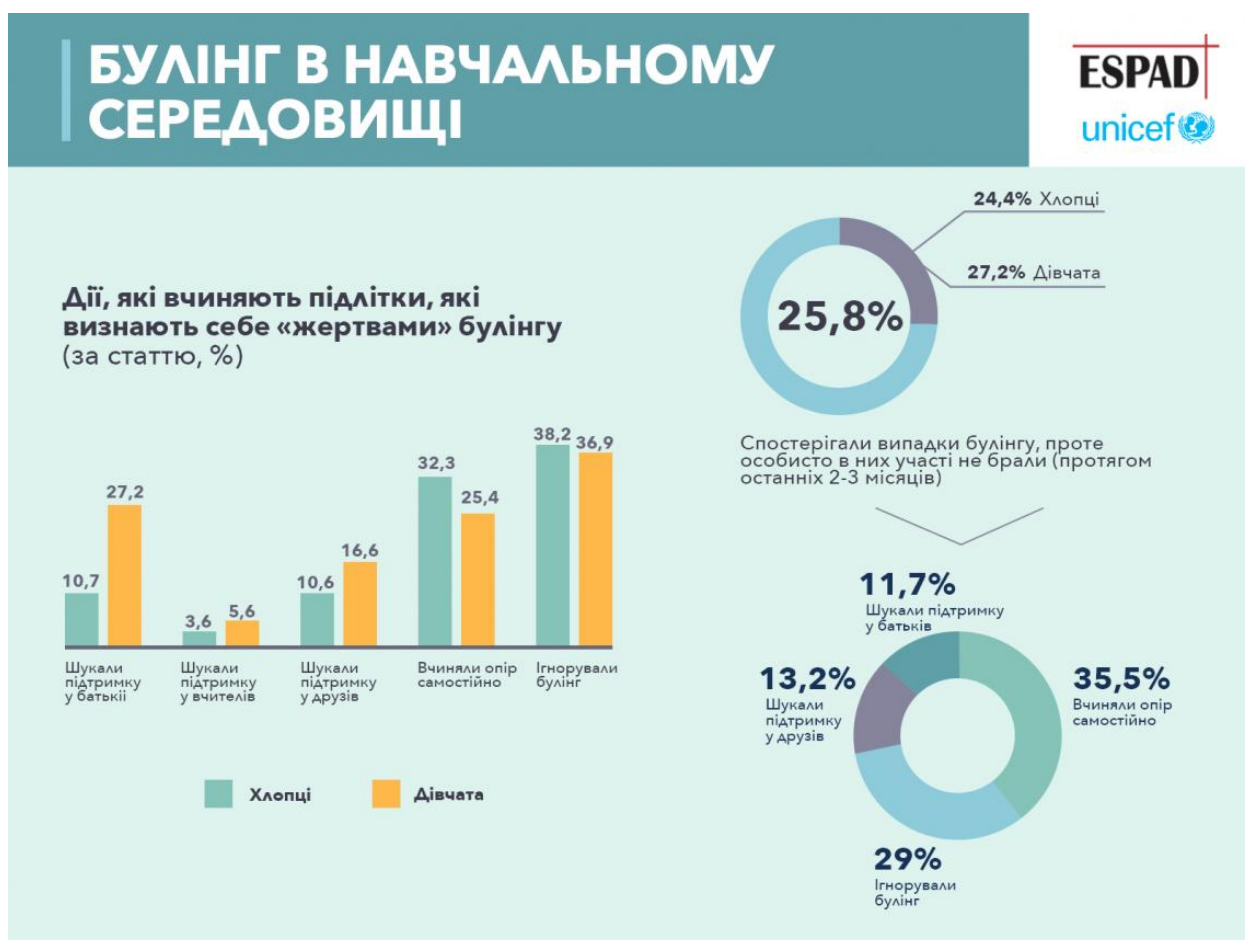
Рисунок 2.2 – Булінг в навчальному середовищі.

більшість дітей булять за те, що вони виглядають, говорять, думають не так, як інші діти. [69]