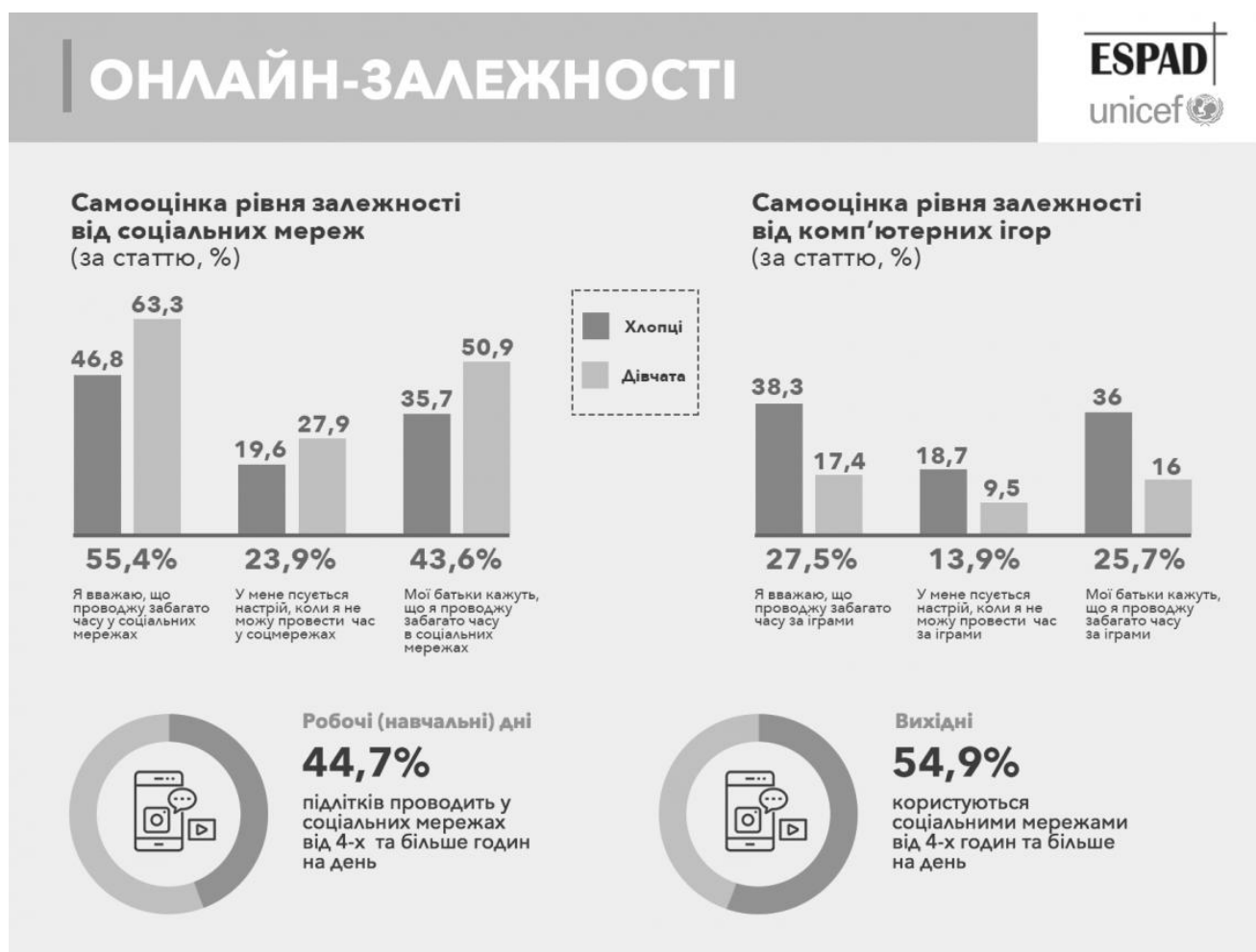
Рисунок 2.1. – Графік онлайн-залежності Unicef.

З кожним км діти все більше прив'язуються до соціальних мереж і це становиться їх життям, їм легше та простіше спілкуватись у соціальних мережах ніж особисто у реальному житті, але у всього є свої негативні сторони кібербулінг є однією з цих сторін, а також залежність яка все швидше набирає обертів малюнок 2.1. [69]