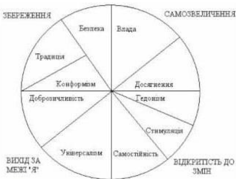
Рис. 2.2 Модель взаємозв'язків десяти типів цінностей за Ш. Шварцом [25]

Шварц у своїй теорії описував динамічні взаємовідносини різних ціннісних типів. Принцип моделі динамічних відносин між ціннісними типами можна спостерігати на рис. 2.2