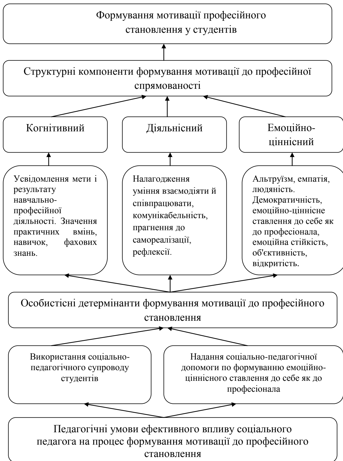
Рис. 2.1. Педагогічні умови системи естетичних цінностей при формування мотивації до професійної діяльності студентів

педагогічної діяльності, яким необхідні спеціально організовані умови супроводу; проводиться аналіз основних закономірностей, тенденцій розвитку на основі соціальних емпіричних даних.