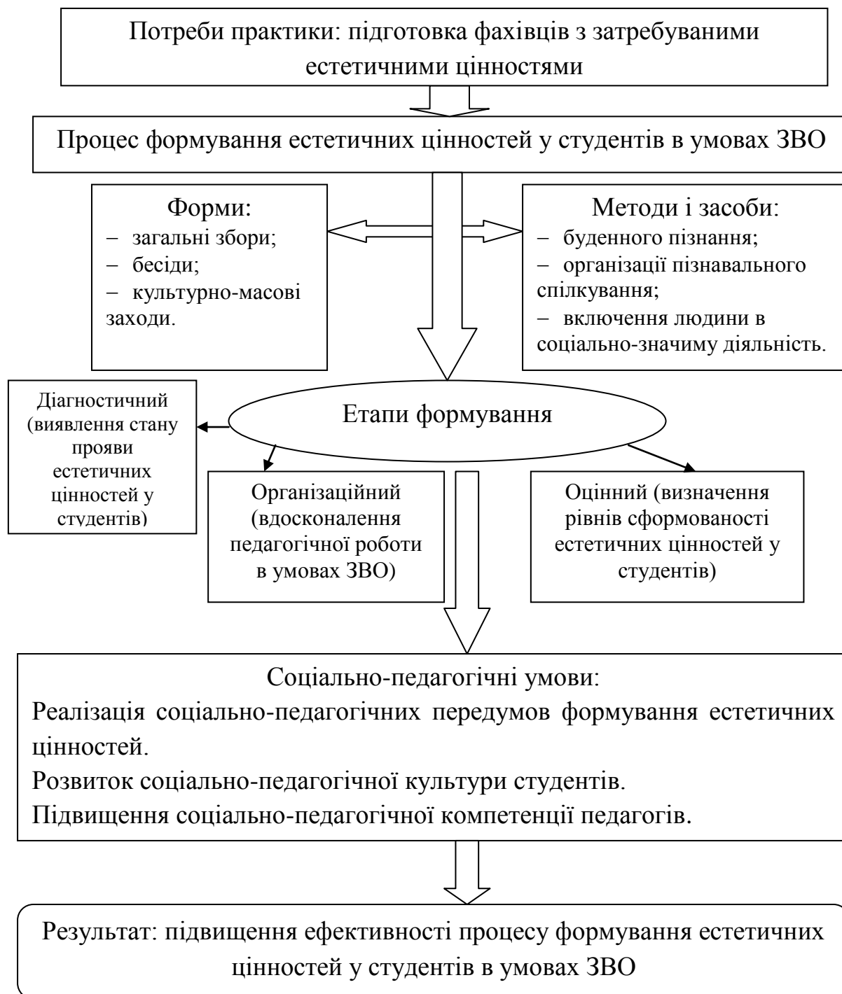
Рис. 2.2. Модель вдосконалення процесу формування естетичних цінностей у студентів в умовах ЗВО

У сучасній педагогічній науці відображені різні класифікації критеріїв, але специфіка ЗВО пред'являє власну систему вимог до змісту та організації, формам і методам виховного процесу, до визначення критеріїв ефективності формування естетичних цінностей у студентів, що навчаються у ЗНУ.