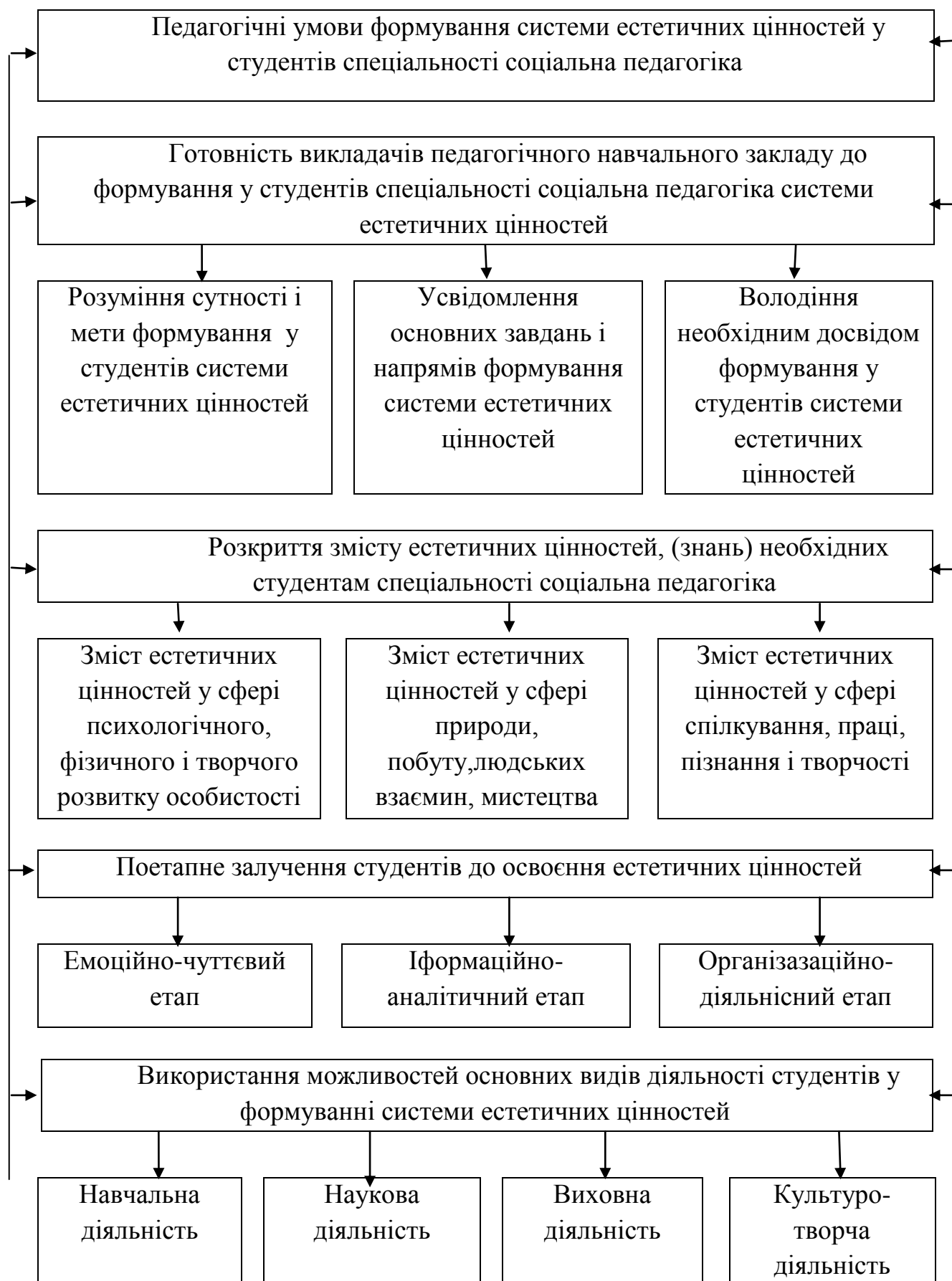
Рис. 1.1. Педагогічні умови формування системи естетичних цінностей у студентів спеціальності соціальна педагогіка