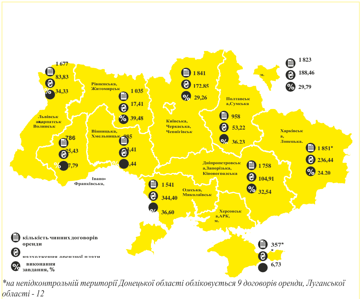
Рисунок 2.1. Інформація щодо договорів оренди та виконання регіональними відділеннями Фонду річного завдання з надходження плати за оренду державного майна до державного бюджету у 2020 році

Близько половини орендної плати до державного бюджету у грудні склали нарахування за 50 договорами, відображеними у рейтингу договорів з найбільшою орендною платою