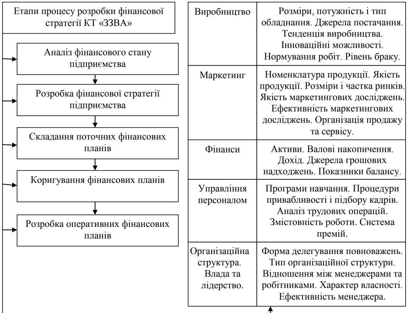
Рис. 2. Процес розробки фінансової стратегії підприємства та його вплив на фінансово-господарську діяльність КТ «Запорізький завод високовольтної апаратури – Вакатов і компанія»

На рисунку 2 наведено процес розробки фінансової стратегії підприємства та його вплив на фінансово-господарську діяльність КТ «Запорізький завод високовольтної апаратури – Вакатов і компанія».