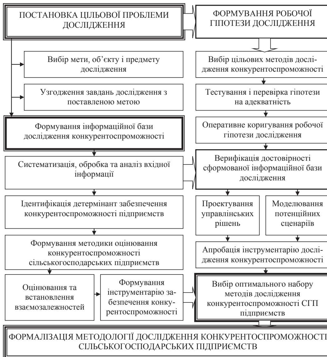
Рис. 1. Алгоритм формування методології дослідження конкурентоспроможності сільськогосподарських підприємств

Систематизація наявних науково-методологічних підходів до оцінювання конкурентоспроможності сільськогосподарських підприємств (системно-орієнтованого, індексного та структурно-функціонального) дала змогу визначити їх позитивні та негативні аспекти в процесі прикладного застосування (табл. 1).