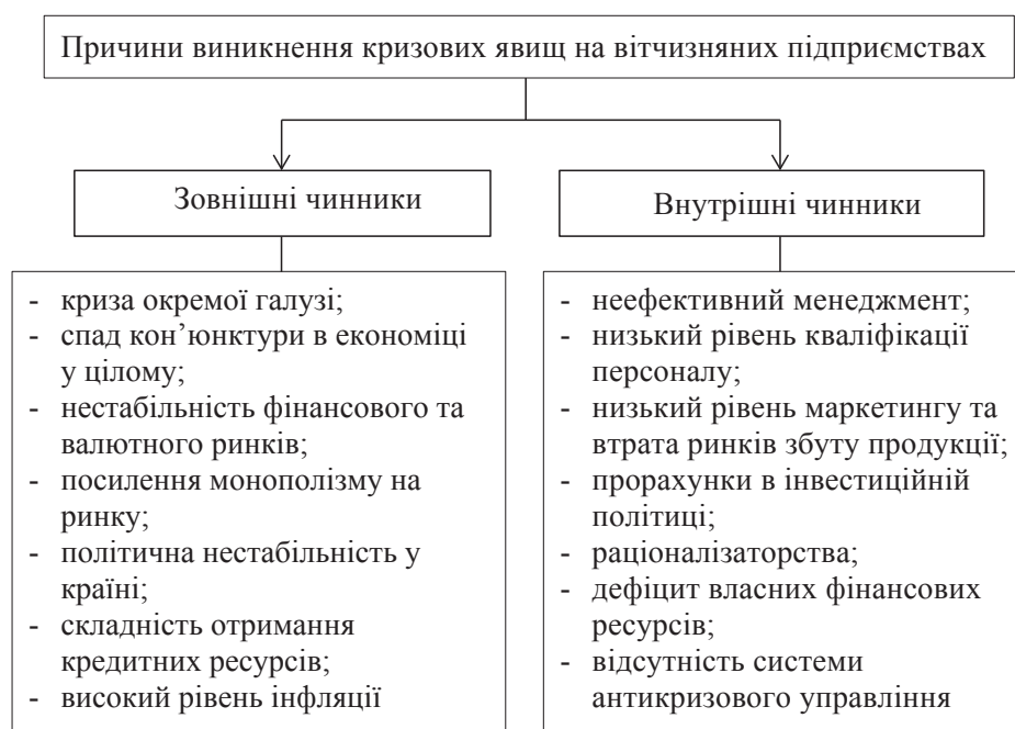
Рис. 1. Причини виникнення кризових явищ на підприємстві [6, с. 50]

Справедливо стверджувати, що управління прибутком на підприємстві – це процес підготовки й прийняття відповідних управлінських рішень з питань його формування, розподілу і цільового використання. У свою чергу, даний процес