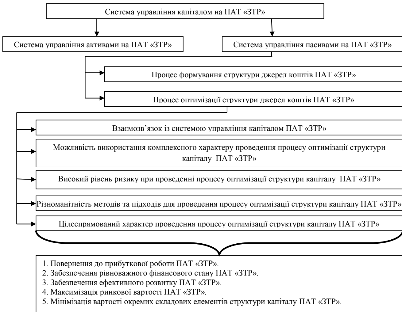
Рис. 2. Місце процесу оптимізації структури капіталу у системі управління капіталом на ПАТ «ЗТР»

процесу оптимізації структури капіталу у системі управління капіталом на ПАТ «ЗТР» проілюструємо на рисунку 2.