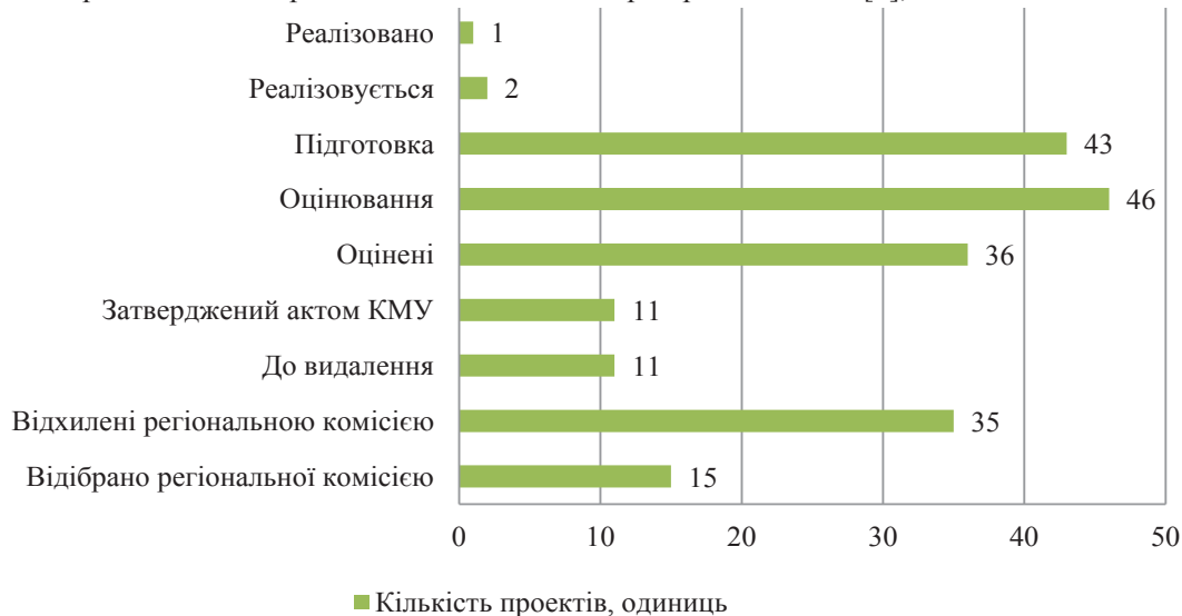
Рис. 1. Кількість розроблених проектів територіальних громад в Україні в розрізі статусу виконання у всіх сферах протягом 2015–2019 рр., кількість (одиниць) Джерело: складено автором на основі [6]