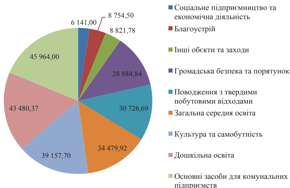
Рис. 4. Структура проектів територіальних громад в Україні в розрізі другорядних сфер реалізації протягом 2015–2019 рр., тис. грн.