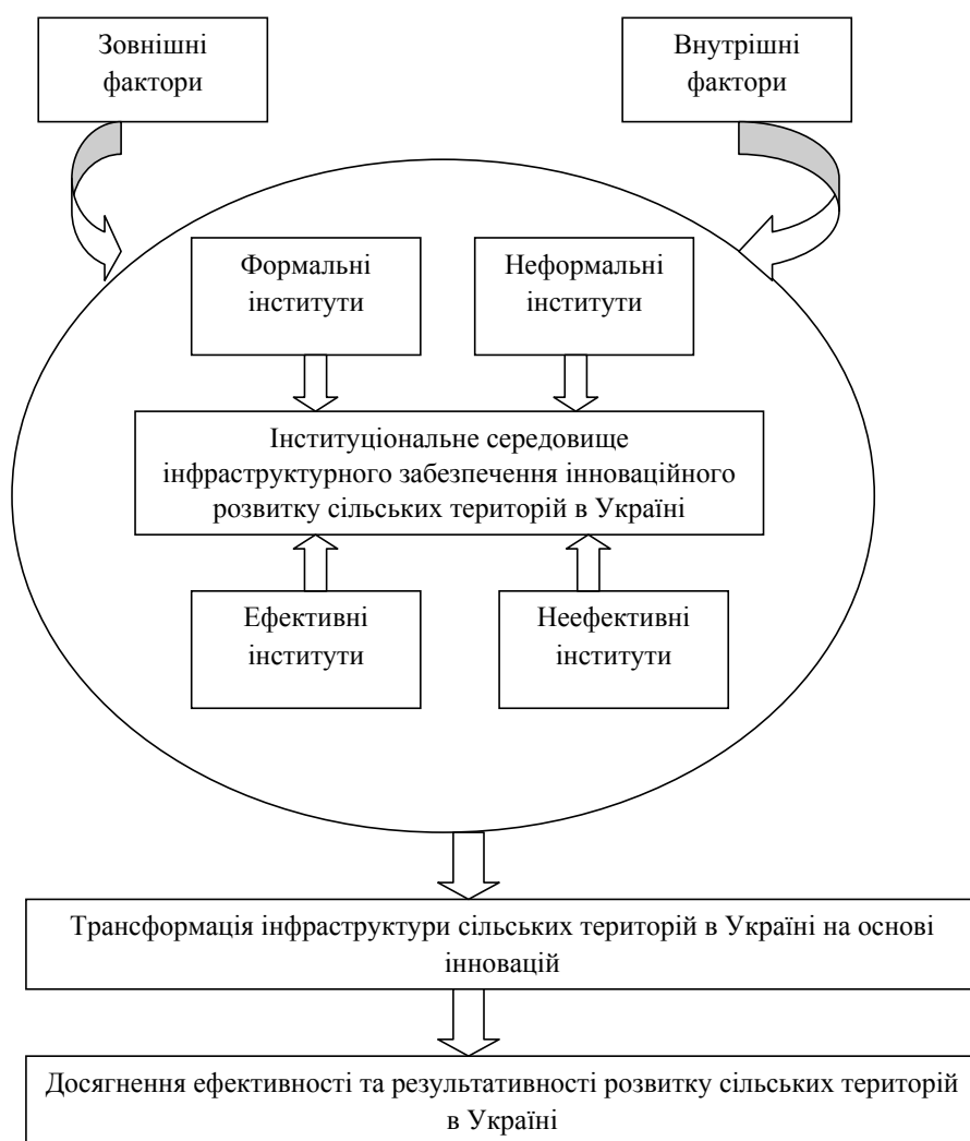
Рис. 1. Інституціональне середовище інфраструктурного забезпечення інноваційного розвитку сільських територій в Україні