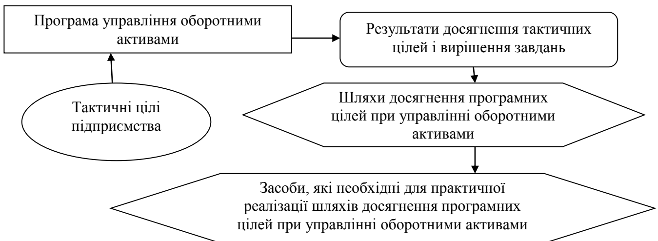
Рис. 4 – Логічна схема програмно-цільового управління оборотними активами підприємства

Програмою управління оборотними активами підприємств є сукупність послідовно виконуваних задач, пов'язаних єдиною метою, спрямованих на вдосконалення процесу управління оборотними активами в умовах заданих обмежень (рисунк 4).