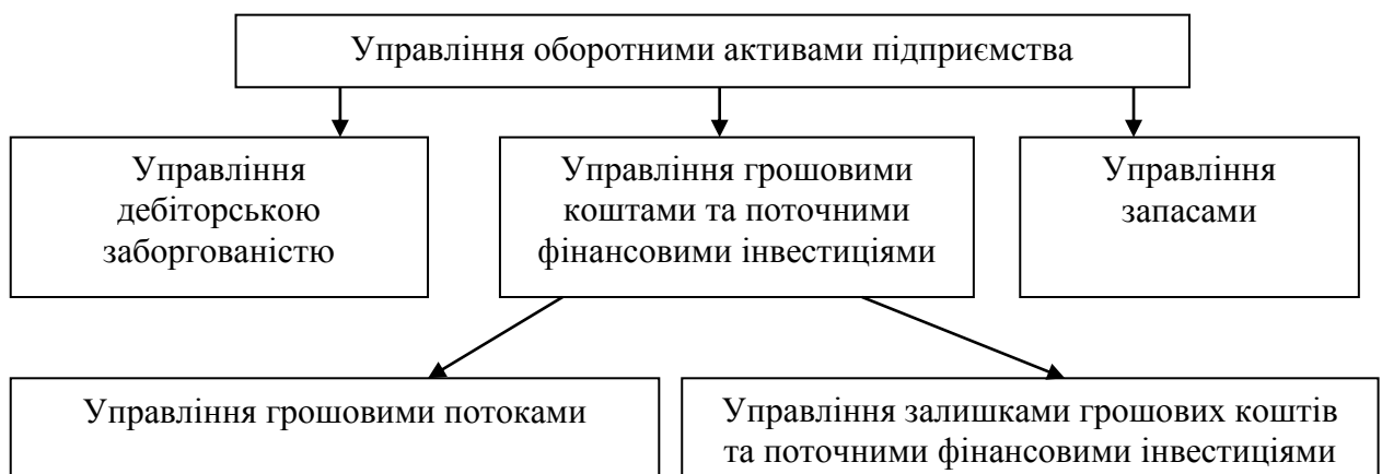
Рис. 3. Напрями управління оборотними активами підприємства

На основі аналізу економічної сутності кожної складової оборотних активів і врахування зарубіжного й вітчизняного досвіду, можна запропонувати такі напрями управління оборотними активами підприємства (рисунок 3).